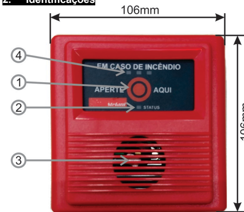
Figura 1: Legenda externa do acionador.